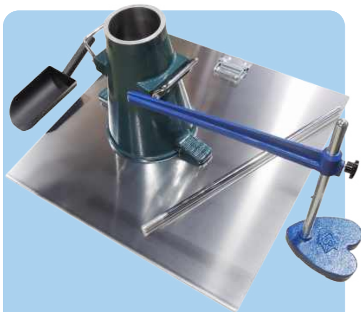
製品番号 KC-394 適用規格：JIS A 1101 (コンクリートのスランプ試験方法)